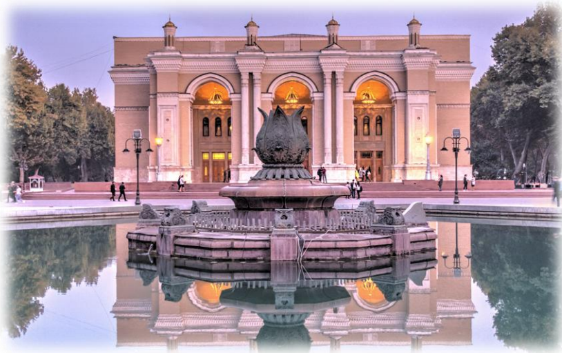
▲国民詩人ゆかりの国立ナヴォイ劇場。第二次大戦後の日本人抑留兵達が建設に参加した。

2026年10月、中央アジア最大の都タシケントにおいて、「日本・ウズベキスタン音楽祭～加藤登紀子コンサートinウズベキスタン」が開催されます。