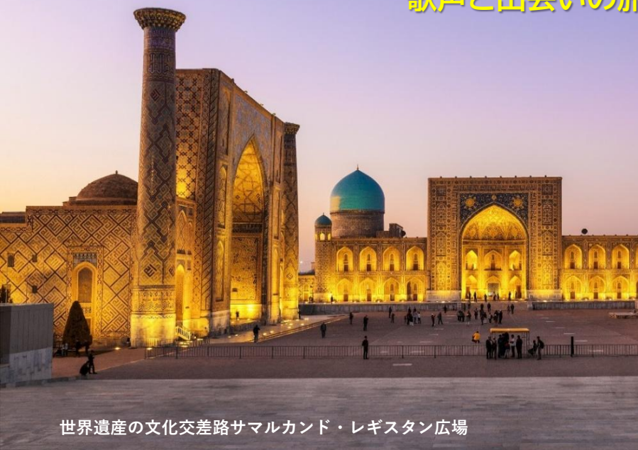
世界遺産の文化交差路サマルカンド・レジスタン広場

中央アジア最大都市タシケント、 青の都サマルカンド、 色鮮やかな大地に、壮麗な歴史を訪ねる 歌声と出会いの旅！