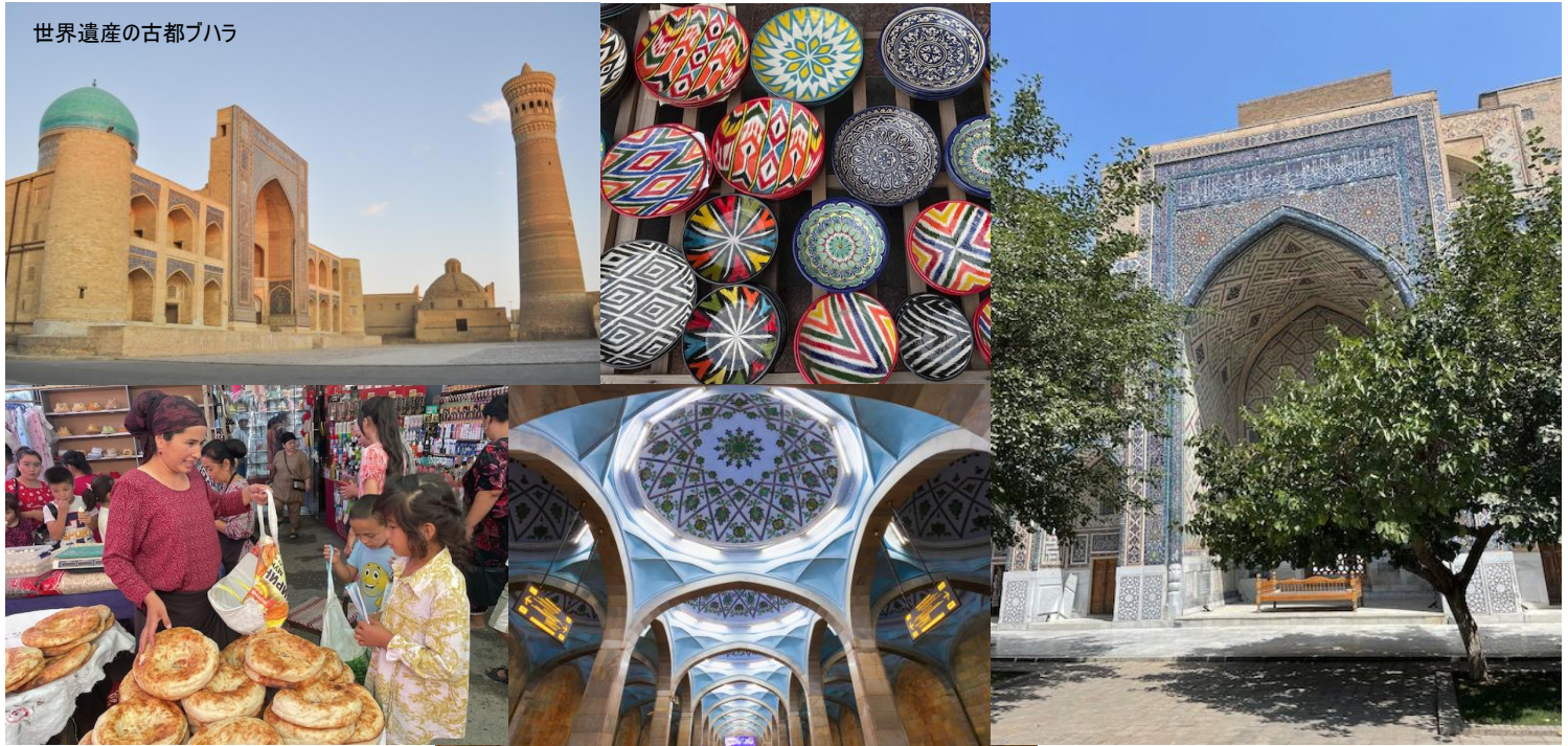
世界遺産の古都ブハラ