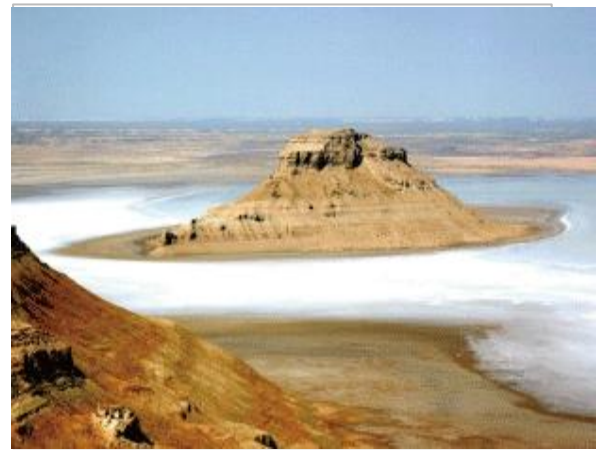
かつて海底だった大地を4WDで駆ける