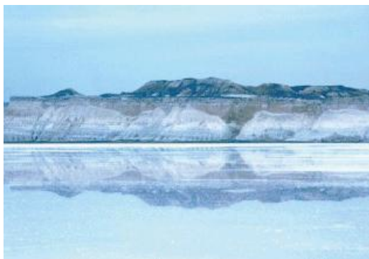
トゥズバイル塩湖