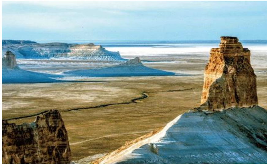
ウスチュルト台地のトゥズバイル塩湖、白垂のボスジラ、他テント3泊4日楽しめます。