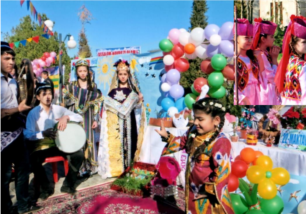
ナウルーズ祭の様子