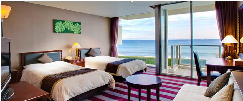
利用予定ホテル: 鴨川グランドホテル (洋室オーシャンフロント ツインルーム)

旅行契約は、「旅行申込書」と「申込金」を受領したときに成立するものとします。お申込成立後、今後のお手続きの流れのご案内をお送りいたしますので、それに従って以降のお手続きをお願い申し上げます。